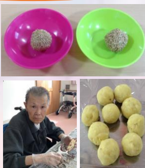
おやつレクを行いました。